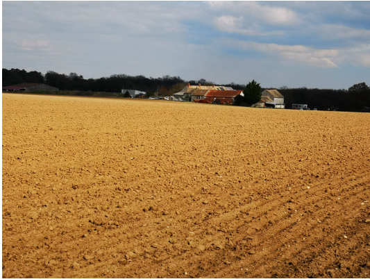
La ferme de Launay