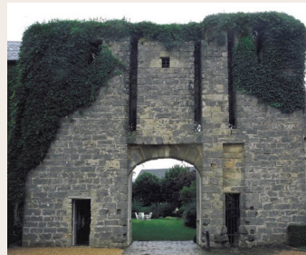
La tour-porche de Boissy-la-Rivière

Les rainures verticales au droit de la porte cavalière et de la porte piétonne étaient destinées aux fleaux de fermeture des ponts-levis associés.