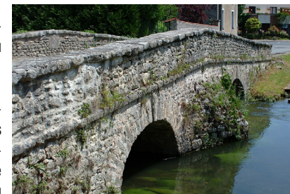
Le pont de Saclas

8 Entrer dans le parc à gauche et, par l'itinéraire utilisé à l'aller, regagner le parking.