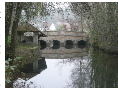
Lavoir et pont d'Ormoy la Rivière

9 Au croisement, prendre le chemin à gauche, tourner à droite et descendre dans le bois le long des clôtures. Suivre la rue de Gérofosse à gauche, l'avenue Frédéric-Louis à droite et franchir la vallée. Passer sous la N 20, poursuivre l'avenue Frédéric-Louis, à droite la promenade des Prés, traverser le petit pont à gauche et poursuivre en face pour rejoindre la passerelle et la rue Sainte-Croix. Prendre la rue Louis-Moreau à gauche, puis rejoindre la gare à droite par la rue Élias-Robert.