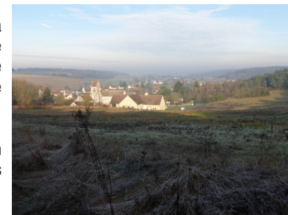
Point de vue Valpuseaux

5 Au carrefour, continuer en face par la rue des Tilleuls. Suivre la rue de la Mairie à gauche et, à droite, retrouver l'église.