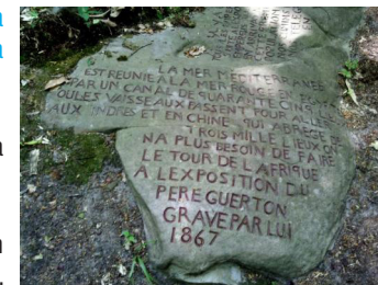
Les roches du Père la Musique