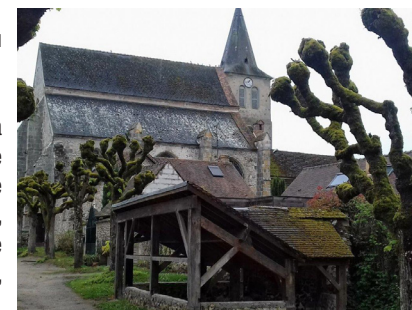
L'église du Val-Saint-Germain

2 À droite, par l'itinéraire utilisé à l'aller, rejoindre la gare.