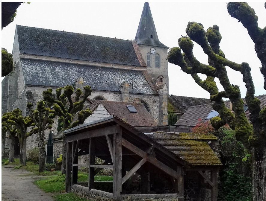
L'église du Val-Saint-Germain