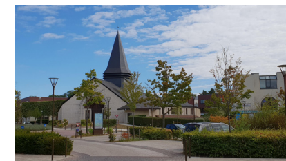
L'église de Chevry