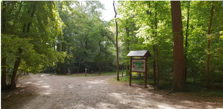
La forêt communale de Gif-sur-Yvette