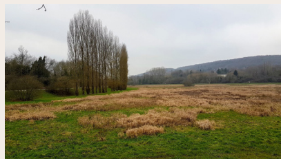
Gif - le bassin de Coupières sur l'Yvette

seaux, le bassin est aujourd'hui classé en secteur ZNIEFF (Zone Naturelle d'Intérêt Écologique, Faunistique et Floristique). On peut également y observer des faisans et des hérons.