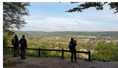
Point de vue sur la vallée