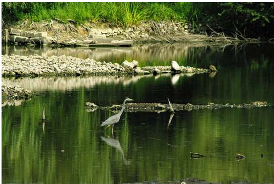
Le marais d'Itteville