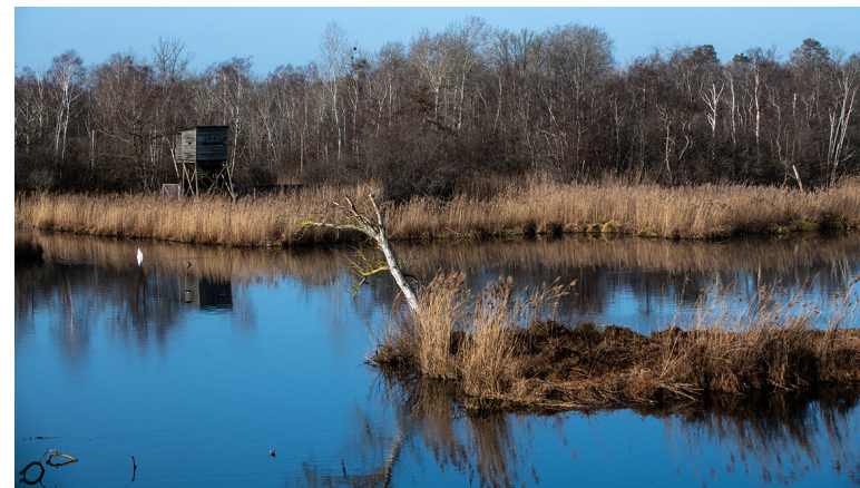
Marais de l'Essonne